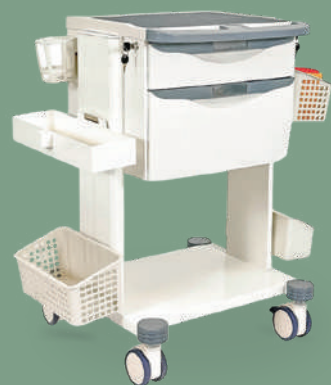
Тележка медицинская универсальная MET SIY-220

НКМИ 187160 Светильник для осмотра, терапевтических процедур передвижной