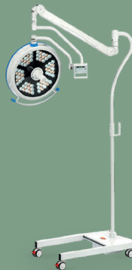
Светильник медицинский светодиодный смотровой передвижной одноблочный MET SO-200

НКМИ 187150 Стол для осмотра/терапевтических процедур, с питанием от сети