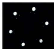
Режим Эндоскопия 500 LED