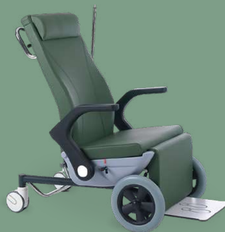
Кресло медицинское многофункциональное для осмотра и процедур MET KM-120

НКМИ 202390 Тележка медицинская универсальная