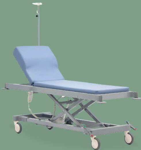
Стол медицинский универсальный модульный для осмотров и процедур MET KS-410